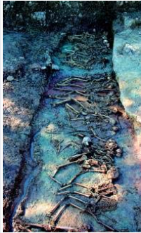
Tomba col·lectiva, probablement d'un pogrom del 1348.