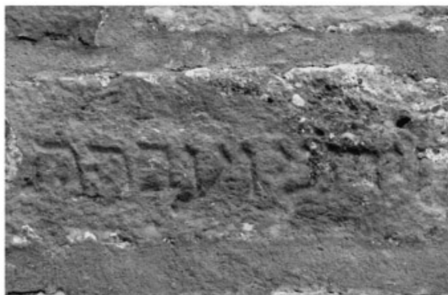
Fragmento de matseva usada en la construcción de un edificio en el barrio gótico de Barcelona.