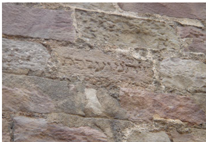
Fragmento de lápida en edificio del s. XVI

Altra referència, de caràcter indirecte i amb data posterior (1368), sembla remetre'ns l'antiguitat del cementiri al S. IX. Es tracta de la comunitat jueva de Tortosa, la qual en adonar-se'n que el seu cementiri està en perill, donen testimoniatge que en ell es troben unes tombes notables, com no existeixen en cap altre lloc del regne amb la única excepció de Barcelona " donde las hay desde hace más de 500 años ".