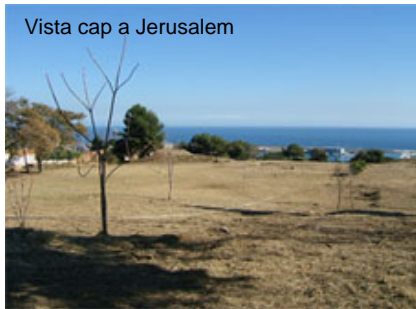
Vista cap a Jerusalem

Dins la tradició jueva, el respecte cap als difunts inclou la prohibició absoluta d'exhumar els cossos, fins i tot segles després de l'enterrament. Aquest fet explica la preocupació que trobem, al món jueu local i internacional, davant l'excavació i l'obertura de tombes al cementiri de Montjuïc. Després de la incoació de l'expedient de declaració de BCIN, també es va sol·licitar informació sobre el destí dels restes excavats per tal de poder donar-les-hi sepultura novament.