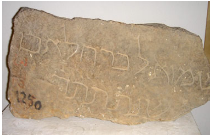
Fragmento de lápida s. XI, en un museo

Jordi Casanovas i Miró va recollir les 74 unitats de tot aquest conjunt epigràfic funerari (el qual havia estat trobat en diferents edificis com a material reutilitzat o en fons museístics) a les Series Hebraica de la Monumenta Paleographica Medii Aevi .