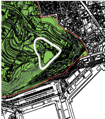
Zona declarada lloc històric

Amb aquestes característiques tan destacades, segons expliquem, i tenint en compte que aquesta peça històrica representa la presència i la memòria de la comunitat jueva a Barcelona durant cinc o sis segles, ens semblava que aquest lloc mereixia un tractament particular, que pogués transmetre tota la profunditat del seu significat. I així ho vàrem comunicar a les comunitats jueves de Barcelona, a les quals vam suggerir la idea que, per dotar el lloc d'una protecció permanent, era necessari sol·licitar al govern de la Generalitat de Catalunya que ho declarés Bien Cultural de Interés Nacional-Lugar Histórico , segons definició de la Ley del Patrimonio Cultural Catalán (Ley 9/1993. DOGC n. 1807, 11/10/1993). Amb l'ineestimable col·laboració del Centro de Estudios de Montjuïc, vam preparar el document per fer realitat aquesta sol·licitud i així hem aconseguit que al Març de 2007 s'incoés l'expedient de declaració. (DOGC Núm. 4849-26.3.2007).